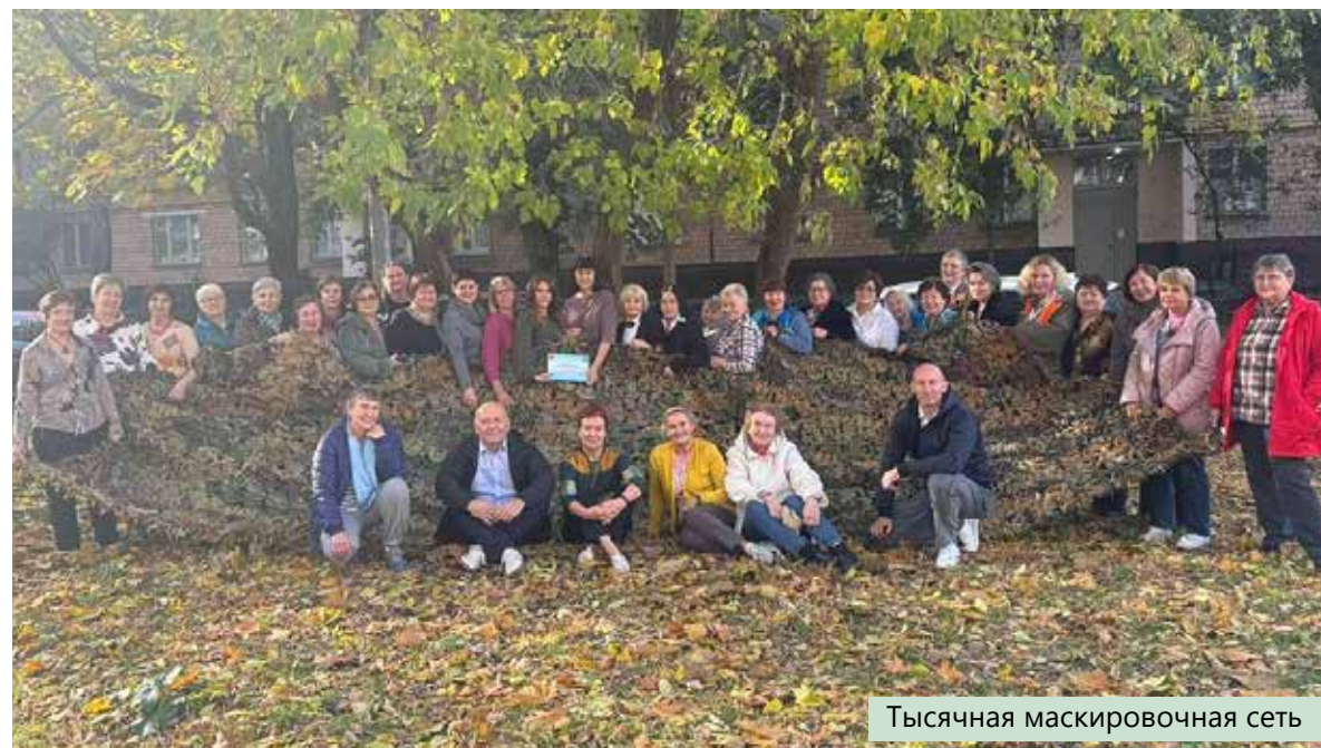
Тысячная маскировочная сеть